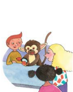
På havnen og hjemme hos Læsefidusen

Tegn historiens handling på tavlen i fællesskab med eleverne, således at sammenhængen mellem episoderne i historien bliver tydelig, og det bliver illustreret, hvor i historien de forskellige personer præsenteres/optræder. Ved at tale om tid, sted og personer kan hele historiens handling gennemgås.