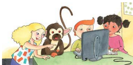
Detektiver på opklaringsarbejde