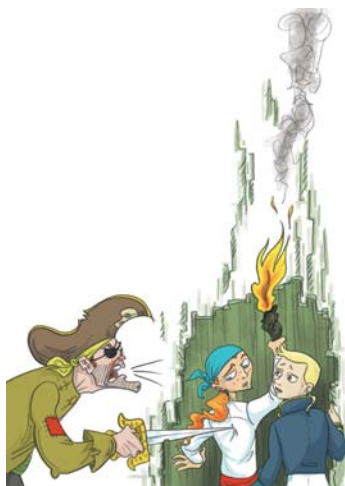
Tim og prins Phillip på skatteøen